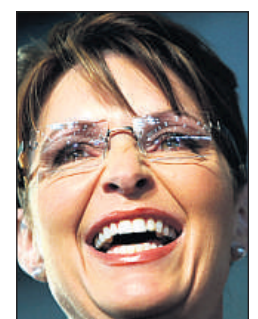
SARAH PALIN Républicaine

49% des électeurs de l'Ohio affirment faire davantage confiance à M. McCain tandis que 41% placent leur confiance dans M. Obama. Mais 40% des électeurs affirment également que M. Obama comprend et prend soin de leurs problèmes. Ils ne sont que 22% à penser que M. McCain comprend leurs difficultés.